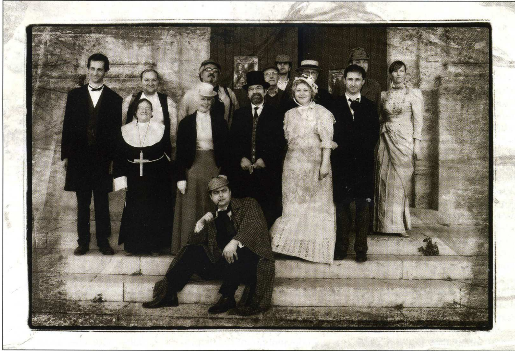
La société Sherlock Holmes de France à Aniane en mai 2008

I naugurée en mars 2007, cette rubrique mensuelle de culture scientifique a donc déjà à son actif un grand nombre de sujets traités. Pour s'y retrouver un petit peu, ce mois-ci sera consacré à un coup d'œil sur les sujets déjà traités et ceux nombreux à venir.